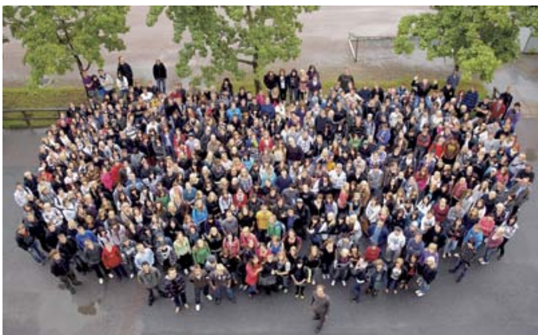
Ryhmäkuva elokuulta 2009.