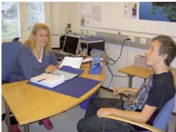
Ohjaustuokio opon huoneessa.