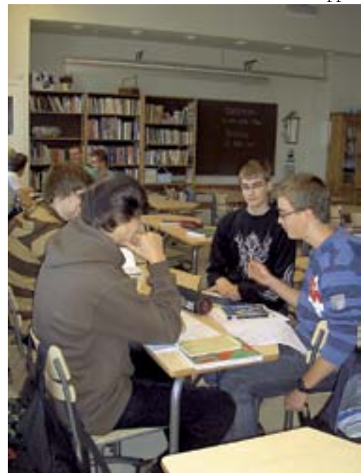
Ryhmätyöskentelyä äidinkielen ja kirjallisuuden oppitunnilla.